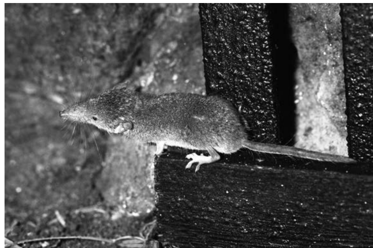
Abb. 1: Die Gartenspitzmaus

Die in der Paläarktischen Region beheimatete Gartenspitzmaus ist in Europa vom NW der Iberischen Halbinsel über Westfrankreich, Italien und Zentraleuropa bis nach Osteuropa und dem Balkan verbreitet (MITCHELL-JONES et al. 1999). In Österreich liegen Nachweise aus allen Bundesländern vor, ihr Verbreitungsschwerpunkt liegt dabei circum-alpin. Im Gegensatz zur Feldspitzmaus dringt sie, aufgrund ihrer höheren Toleranz gegenüber Feuchtigkeit, auch in die Alpentäler vor (SPITZENBERGER 1985, 2001).