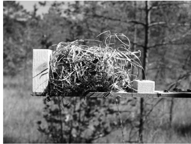
Abb. 3. Material in Neströhre.

dend bei der Standortwahl war die optimale Zugänglichkeit über querverlaufende Äste, eine gute Deckung und die Nähe zu fruchttragenden Sträuchern. Bei den Kontrollen im August/September wurden die Tiere lebend gefangen und das Geschlecht, das Gewicht, das kategorische Alter (juvenil, sub-adult, adult) sowie der Gesundheitszustand nach äußeren Merkmalen erhoben. Die Freilassung der Tiere geschah am Fangort. Aus jedem Gebiet erfolgte die Entnahme und Aufbewahrung einer Haselmaus-Haarprobe als genetischer Beleg.