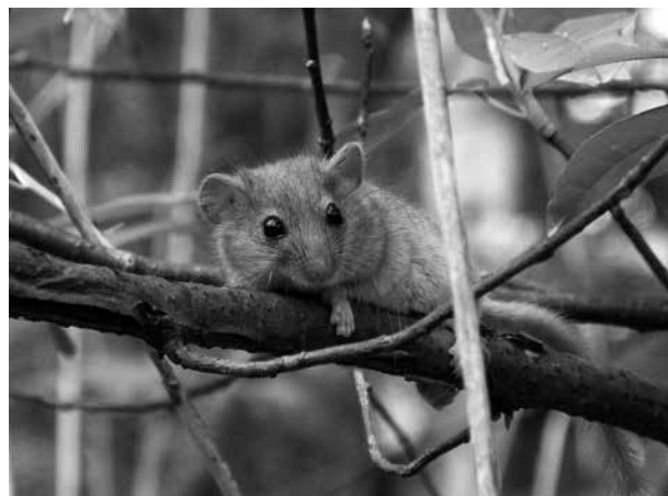
Abb. 6. Gebüschreihen erwiesen sich als wichtige Lebensräume (Foto: Blatt/Resch).

materialien und anhand von Exemplaren. Aber auch mit Zuordnungen von Fraßspuren und Bauen konnten einige Kleinsäuger dokumentiert werden. Vergleichsweise selten erfolgte die Bestimmung durch Losungsauswertungen oder direkte Beobachtungen (Tab. 1).