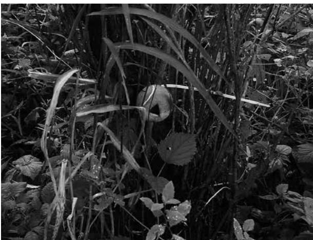
Abb. 4. Nestball.

Der Nachweis von Wasserspitzmäusen erfolgte mit Losungstunneln (Abb. 5). Diese Polypropylen-Rohrstücke ( d = 4,5 \text{ cm} , l = 20 \text{ cm} ) wurden mit gekochten Mehlwürmern beködert und in regelmäßigen Abständen entlang geeigneter