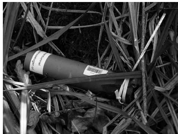
Abb. 5. Losungstunnel (Foto: Blatt/Resch).