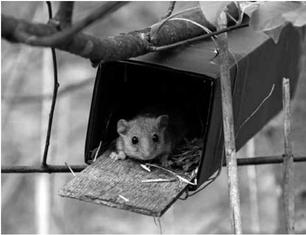
Abb. 2. Neströhre (Foto: Blatt/Resch).