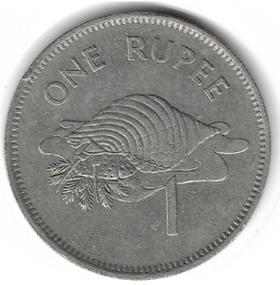
Charonia tritonis mit Acanthaster planci , Seychellen