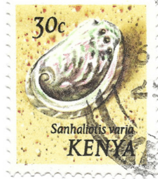
Haliotis varia , Kenia