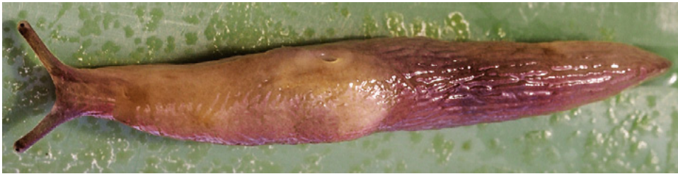
Deroceras invadens in Salzburg-Parsch. Aufgenommen am 24. 9. 2020. Invent. Nr.: HNS_M_01977.