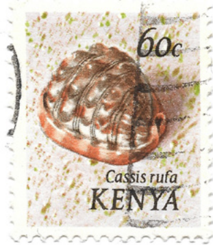
Cypraecassis rufa , Kenia