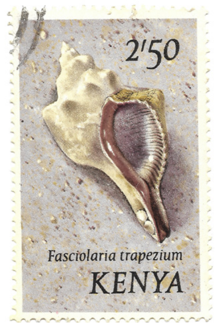
Pleuroploca trapezium , Kenia