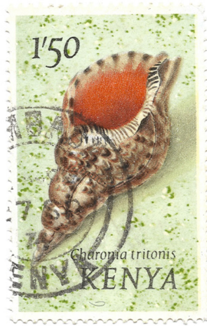
Charonia tritonis , Kenia