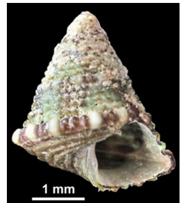
Jujubinus baudoni (Monterosato, 1891) (Trochidae). Gesammelt von R. Patzner in Südfrankreich, September 1980. Invent.-Nr. HNS_M_50011.

Patzner R.A., Kwitt S. & R. Lindner (2019): Die Mollusken-Sammlung von Peter Sperling am Haus der Natur in Salzburg. Mitt. Haus der Natur 25: 124-133