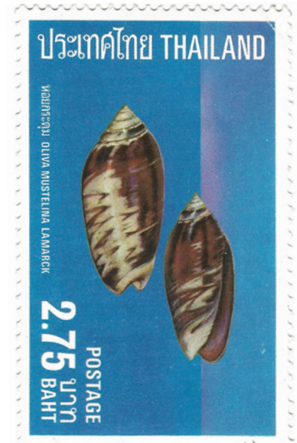
Oliva mustelina , Thailand