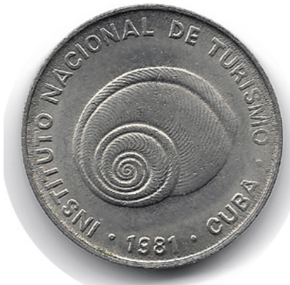
Polymita picta , Kuba