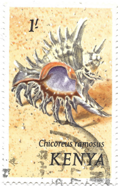
Chicoreus ramosus , Kenia