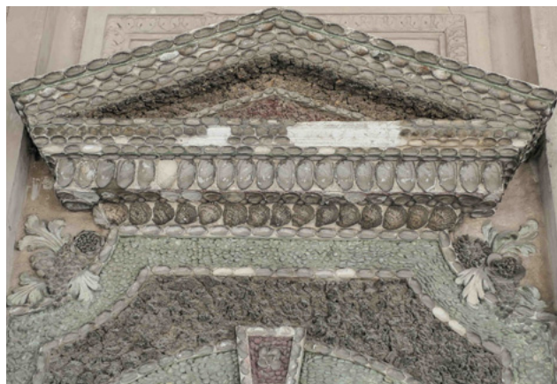
Unio crassus vom Haus der Natur für die Restaurierung der Brunnen im Hofgartentempel nach München geschickt. Siehe nächster Newsletter.