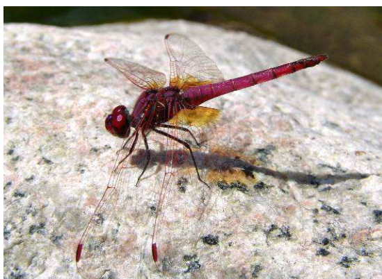
Abbildung 2: Der Violette Sonnenzeiger Trithemis annulata (Beauvois, 1805), aufgenommen im Cavu-Tal (Korsika)

In diversen Beiträgen unseres Newsletters berichteten wir bereits über Schmetterlings- und Käferarten, die sich nach Einschleppung in Europa etabliert haben (GEISER 2009a, 2009b, GROS 2010, 2012). 2009 meldete ich auch den Fund des Trauer-Rosenkäfers, der durch offensichtlich spontane Ausdehnung des ursprünglichen Areals Salzburg erreicht hat (GROS 2009). Solche Ausbreitungsereignisse sind auch bei Libellen bekannt: In diesem Zusammenhang will ich dem Leser nun den Violetten Sonnenzeiger Trithemis annulata (Beauvois, 1805) vorstellen.