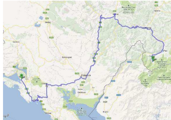
Abbildung 10: Anreise nach Vusanje

Über Herceg Novi ging es weiter zur Fähre über die Bucht von Kotor Richtung Tivat. Dadurch ersparte ich mir knapp 50km bzw. eine Stunde Autofahrt rund um die geschichtsträchtige Bucht.