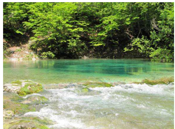
Abbildung 18: Im Prokletije Gebirge befinden sich zahlreiche Quellen.

Der befahrbare Schotterweg führt mich von Vusanje entlang eines Baches sanft bergauf.