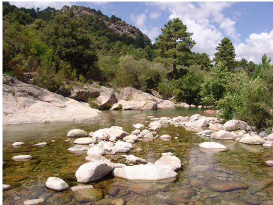
Abbildung 3: Lebensraum des Violetten Sonnenzeigers im Cavu-Tal (Korsika)

Diese sehr schöne Libelle aus der Familie der Segellibellen (Libellulidae) (Abbildung 2) zählt zu den weit verbreiteten Arten in Afrika, darüber hinaus erreicht sie auch Südwestasien im Osten. Erst 1978 in Spanien nachgewiesen, wurde sie in Korsika zum ersten Mal 1989 beobachtet. Auf dem südfranzösischen Festland dauerte es bis 1994, ehe sie hier wahrgenommen wurde. Um dieselbe Zeit besiedelte sie auch Teile Italiens. Inzwischen wurde sie auch im südlichen Balkan festgestellt, und breitet sich weiter aus: es ist zu erwarten, dass sie in naher Zukunft das gesamte Mittelmeergebiet und einen Teil des südeuropäischen atlantischen Küstengebietes besiedelt haben wird (vgl. DIJKSTRA 2006, GRAND & BOUDOT 2006).