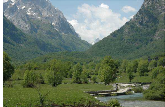
Abbildung 16: Am Weg von Vusanje Richtung albanischer Grenze auf etwa 900m.

Die nächsten Tage verbringe ich in der nächsten Umgebung von Gusinje und Vusanje auf der Suche nach der Urmotte Micropterix jeanneli .