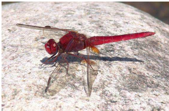
Abbildung 5: Auf den ersten Blick mit dem Violetten Sonnenzeiger zu verwechseln: Die Feuerlibelle Crocothemis erythraea (Brullé, 1832).

ten Feuerlibelle C. erythraea (Abbildung 5). Diese ist aber etwas größer und „plumper“ aufgebaut, und von Kopf bis Fuß feuerrot gefärbt. In Ruhestellung streckt sie ihre Flügel meistens weiter nach vorne als T. annulata . Letztere ist hingegen von rotviolettem Glanz, ihre Beine aber sind dunkel gefärbt. Bei näherer Betrachtungsweise sind ihre Flügel auch anders gestaltet. Wie auf Abbildung 2 erkennbar, sind die Adern ihrer Flügel auch ausgedehnt gelb-rot gefärbt.