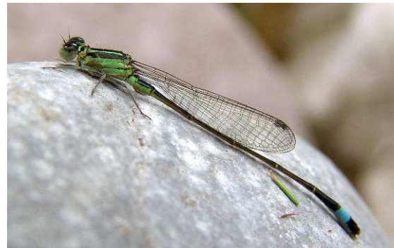
Abbildung 4: Die Tyrrhenische Pechlibelle Ischnura genei (Rambur, 1842), eine Begleitart des Violetten Sonnenzeigers in Korsika.

al und verteidigen hartnäckig kleine Reviere. In einem ca. 50 m 2 großen Bereich um seine Anwartstelle attackierte ein Männchen alle vorbei fliegenden Libellen seiner Größenklasse: dort waren das die Kleine Königslibelle Anax parthenope (Sélys, 1839), aber auch und v. a. die ihm sehr ähnlich sehende Feuerlibelle Crocothemis erythraea (Brullé, 1832), die ein vergleichbares Territorialverhalten zeigte. Obwohl sie etwas größer als T. annulata sind, ließen sich die derart angegriffenen Feuerlibellen dort jeweils vertreiben. Die beobachteten Individuen von T. annulata verhielten sich überhaupt sehr energisch: sie flogen bei kleinster Beunruhigung auf, um gleich etwas weiter wieder Platz zu nehmen, was das Fotografieren deutlich erschwerte. Der wendige und schnelle Flug dieser Libellenart verriet das gute Potenzial für Arealerweiterungen!