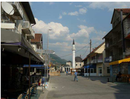
Abbildung 15: Innenstadt von Gusinje mit Moschee im Hintergrund

10 Stunden später bin ich in Gusinje angekommen und genieße das orientalische Flair dieser Stadt.