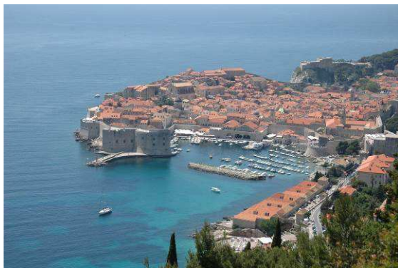
Abbildung 9: Blick auf die malerisch gelegene Stadt Dubrovnik

Die Anreise bis Dubrovnik gestaltete sich einfach, da nahezu entlang der gesamten dalmatinischen Küste die Autobahn bereits fertiggestellt ist. Lediglich die letzten 120 Kilometer vor Dubrovnik mussten über die gut ausgebaute Küstenstraße zurückgelegt werden.