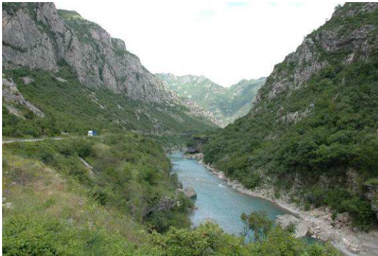
Abbildung 14: Flussbett der Morača, nördlich der montenegrinischen Hauptstadt Podgorica

Nach einem kurzen Tankstopp geht es weiter dem Fluss Morača entlang Richtung Nordosten.