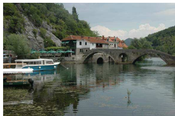
Abbildung 12: Alte Brücke über einen Zufluss zum Skodarsee in Rijeka Crnojevic bei Cetinje der alten Königsstadt Montenegros

Von Cetinje erreicht man Podgorica, die Hauptstadt von Montenegro mit knapp 160.000 Einwohnern nach etwa einer Stunde reiner Fahrzeit.