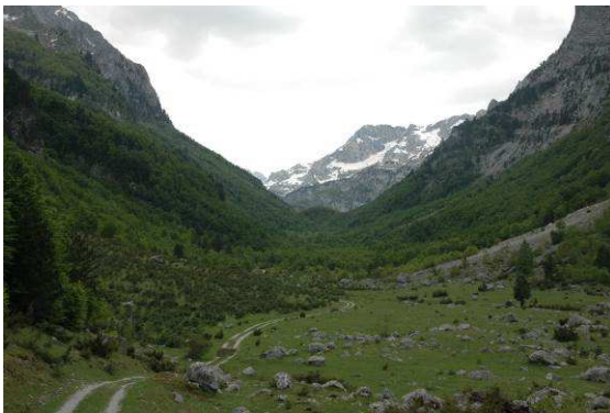
Abbildung 20: Hochebene nahe der albanischen Grenze auf etwa 1100m.