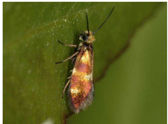
Abbildung 24: Micropterix amsella Heath, 1975 aus der Umgebung von Cetinje

Trotz des Nichtfindens von Micropterix jeanneli waren meine Reisen in diese kaum erforschte Region des Balkans doch erfolgreich und interessant, wie die folgenden Fotos zeigen. Ich bin schon höchst gespannt, was mich heuer dort erwarten wird.