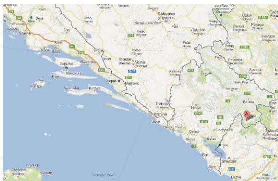
Abbildung 7: Gusinje ist eine Stadt in Montenegro, die im historischen Gebiet des Sandschaks von Novi Pazar auf 925 m im Tal der oberen Ljuča liegt.

2011 und 2012 unternahm ich jeweils eine zweiwöchige Reise nach Montenegro. Ziel war jedesmal die Gebirgsregion Prokletije