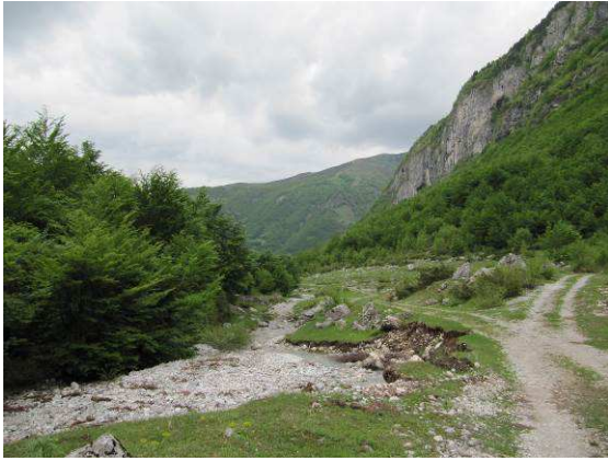
Abbildung 19: Am Weg von Vusanje Richtung albanischer Grenze auf etwa 1100m.