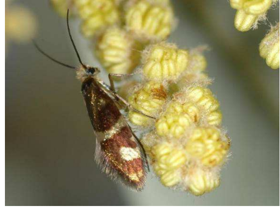
Abbildung 27: Typisch gezeichnete Form von Micropterix facetella Zeller, 1851 in der Nähe von Baška Voda in Kroatien.