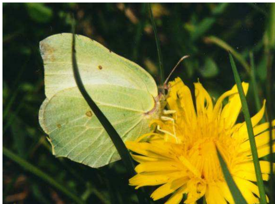
Abbildung 1: Einer der ersten Frühjahrsschmetterlinge, der Zitronenfalter Gonepteryx rhamni (Linné, 1758).

Liebe Mitglieder! Freunde der entomologischen Arbeitsgemeinschaft!