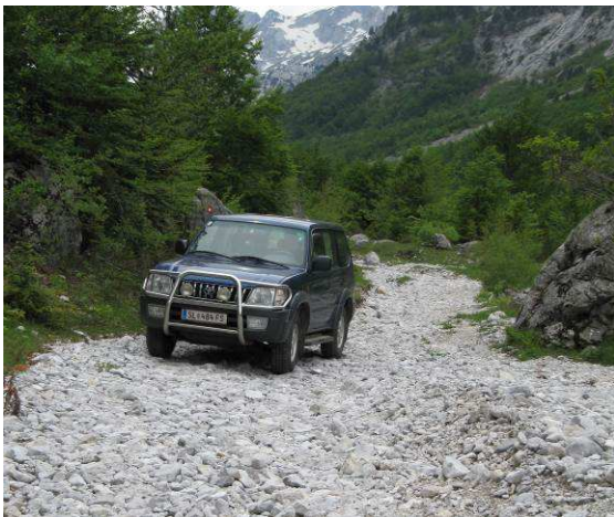
Abbildung 21: Ende der befahrbaren Strecke auf etwa 1100m. Aus dem Schotterweg wird ein Bachbett.

Auf etwa 1100m endet der Schotterweg auf dieser malerischen Hochebene. Ein Weiterkommen mit dem Auto war nicht mehr möglich. Nach etwa 3 Stunden Aufstieg zu Fuss erreiche ich diese Almwiese auf etwa 1400m.