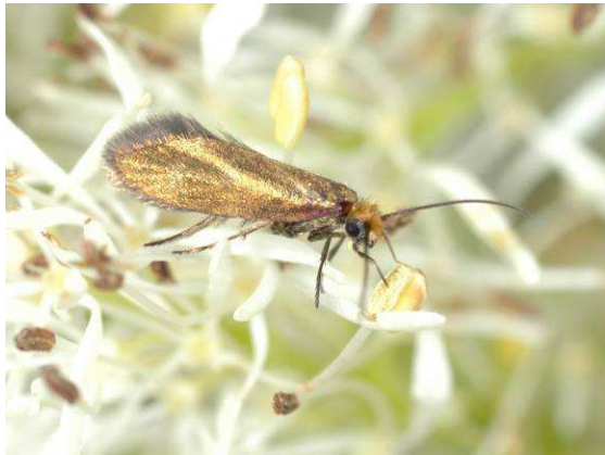
Abbildung 26: Zeichnungslose Form von Micropterix facetella Zeller, 1851 aus der Umgebung von Cetinje. Trotz der deutlichen habituellen Unterschiede (siehe Abbildung 27) lassen sich keine anatomischen Unterschiede zur Nominatform finden.