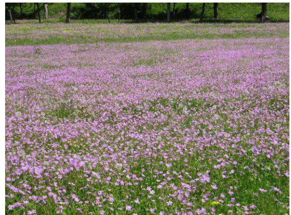
Abbildung 17: Blütenreiche Wiesen säumen den Weg.