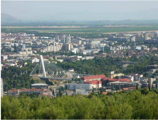
Abbildung 13: Podgorica

Nach einem kurzen Tankstopp geht es weiter dem Fluss Morača entlang Richtung Nordosten.