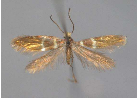
Abbildung 8: Eines der beiden Weibchen dieser Art (Naturhistorisches Museum Wien)

Ich nehme es vorweg. Leider ich konnte Micropterix jeanneli weder 2011 noch 2012 finden. Ich möchte aber dem Leser diesen eindrucksvollen und wunderschönen Teil des Balkans nicht vorenthalten.