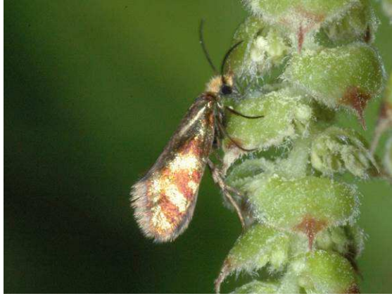
Abbildung 25: Micropterix tunbergella (Fabricius, 1787) bei Vusanje