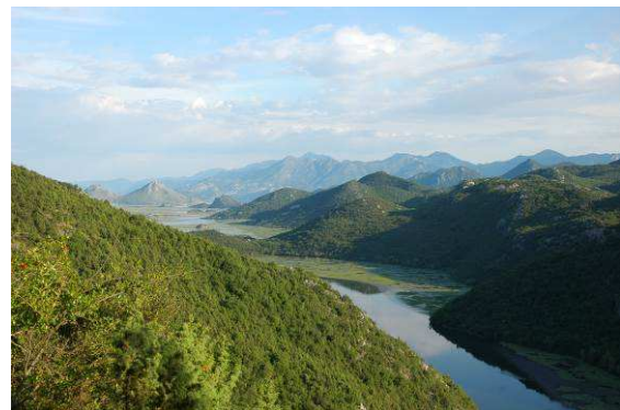
Abbildung 11: Blick auf den weit verzweigten Binnensee und Nationalpark Skodar

Weiter geht es Richtung Podgorica an Cetinje und dem Nationalpark Skodar vorbei.