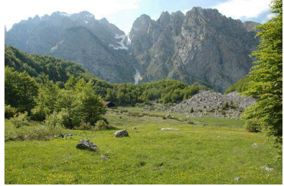
Abbildung 22: Almwiese auf 1400m. Ist das der Typenfundort von Micropterix jeanneli ?

Auf etwa 1100m endet der Schotterweg auf dieser malerischen Hochebene. Ein Weiterkommen mit dem Auto war nicht mehr möglich. Nach etwa 3 Stunden Aufstieg zu Fuss erreiche ich diese Almwiese auf etwa 1400m.