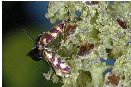
Abbildung 13: Micropterix schaefferi Heath, 1975, pollenfressend auf Grünerle

Statt des erhofften Nachweises des Grünerlen-Trugfalter konnte ich auf 1800m zumindest zahlreiche hübsche Urmotten der Art Micropterix schaefferi Heath, 1975 – ebenfalls auf blühender Grünerle – finden.