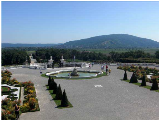
Abbildung 2: Blick über die Terrassen des barocken Gartens in Schloss Hof