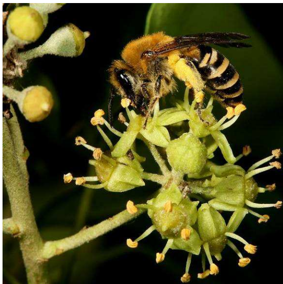
Abbildung 8: Colletes hederiae , die Efeu-Seidenbiene