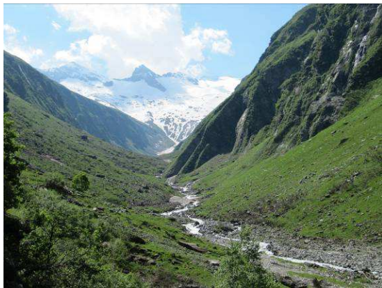
Abbildung 11: Habachtalschluss mit Blick auf den Kratzenberg und Schwarzkopf

Dr. Peter Huemer entdeckte im Zuge entomologischer Exkursionen im Jahr 2006 im Habachtal bzw. im Obersulzachtal Blattminen auf Grünerlen ( Alnus viridis DC.) die dem Grünerlen-Trugfalter Eriocrania alpinella Burmann, 1958 zuzurechnen sind (Embacher & Huemer, 2008).