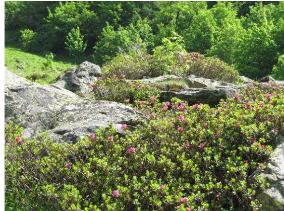
Abbildung 12: Rostblättrige Alpenrose ( Rhododendron ferrugineum L.) vor umfangreichem Grünerlenbestand auf etwa 1700m

erlenbeständen dieses Tier – leider erfolglos – zu finden.