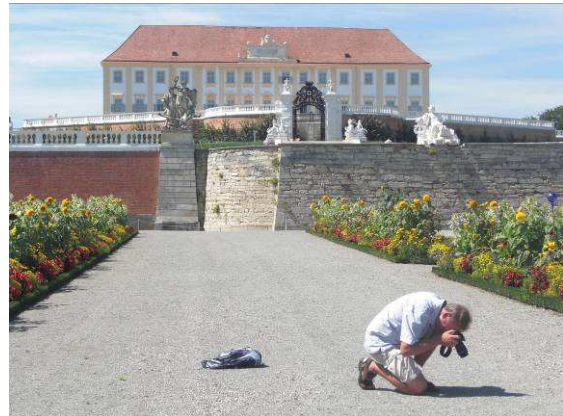
Abbildung 3: Fotoshooting für die Blauflügelige Sandschrecke

Kategorie „critically endangered“ auf „endangered“ zurück gestuft (Berg, Bieringer & Zechner 2005).