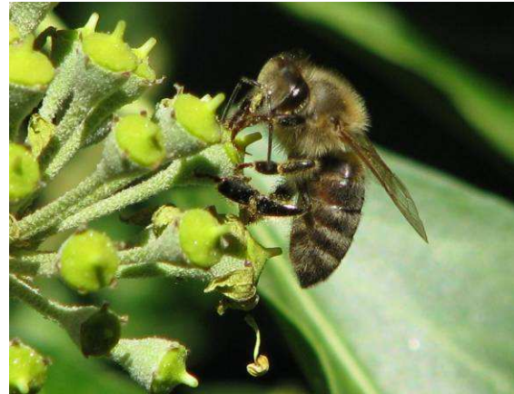
Abbildung 9: Apis mellifera , die Honigbiene

Die Efeu-Seidenbiene sammelt Pollen ausschließlich an Efeu und fliegt von Anfang September bis Mitte Oktober. Sie nistet in Deutschland häufig in Sandkisten von Kinderspielflächen. Über Mitteilungen von Funden der Efeu-Seidenbiene freue ich mich. Auch eine Information darüber, dass Sie diese Art (noch) nicht finden konnten, ist sehr wertvoll.