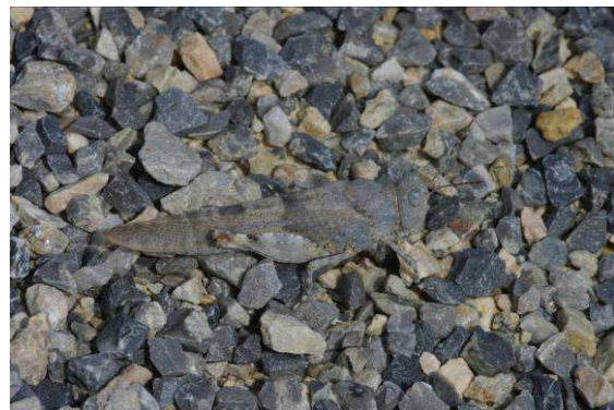
Abbildung 4: Ein Weibchen der im Kiesbett hervorragend getarnten Sphingonotus caerulans (Linné, 1767), der Blauflügeligen Sandschrecke

Beim Besuch des Schlosses Hof und beim Lustwandeln im schönen Barockgarten im August 2011 flog plötzlich auf den weiten Kiesflächen eine unscheinbare Heuschrecke vor uns auf und ließ sich kurz darauf wieder nieder. Irgendwie schien auch ein bläulicher Farbton im Flug aufzublitzen und so war unsere Neugierde geweckt. Kurz darauf flog eine zweite Heuschrecke auf und damit war die Pirsch eröffnet. Vergessen waren für einen Moment die schönen Gartenanlagen. Weitere Heuschrecken folgten und diesmal merkten wir uns den Landeplatz.