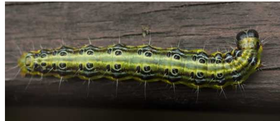
Abbildung 7: Raupe des Buchsbaumzünslers

Die hübschen, bunten Raupen des Zünslers sind im Endstadium ca. 5 cm lang, leben anfangs versteckt meist im Inneren des Buchsbaumes in einem dichten Gespinnst und fressen sich später nach außen durch, wobei sie den befallenen Baum vernichten und zum Absterben bringen können.