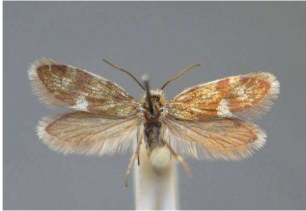
Abbildung 10: Grünerlen-Trugfalter Eriocrania alpinella Burmann, 1958

Dr. Peter Huemer entdeckte im Zuge entomologischer Exkursionen im Jahr 2006 im Habachtal bzw. im Obersulzachtal Blattminen auf Grünerlen ( Alnus viridis DC.) die dem Grünerlen-Trugfalter Eriocrania alpinella Burmann, 1958 zuzurechnen sind (Embacher & Huemer, 2008).