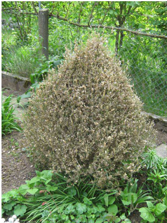
Abbildung 6: Befall eines Buchsbaumes durch den Buchsbaumzünsler

Wie viele andere Insektenarten und auch Pflanzen wurde der Schmetterling vermutlich durch den internationalen Handel aus dem asiatischen Raum nach Europa eingeschleppt und kann sich hier offensichtlich – wie bereits mehrfach belegt – mit unserem heimischen Buchsbaum Buxus sempervirens L. verbreiten und sich auch reproduzieren.