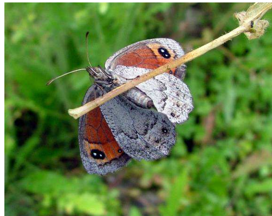
Abbildung 24: Die typische Unterseite des Weibchens, woran man diese Tagfalterart gut erkennen kann.

Vielfach trifft man die Erebia styx (Freyer, 1834) in denselben Biotopen wie der Apollofalter. Beide mögen es heiß und trocken. Geröllhalden und stark felsdurchsetztes Offenland: Da befinden sich diese Arten in ihrem Element. Denn dort wächst auch die Futterpflanze der Raupe des Styx-Mohrenfalters, der Blauschwengel. Diese kurze und dünne Grasart ist sehr widerstandsfähig und gedeiht gerade auf trockenem Boden.