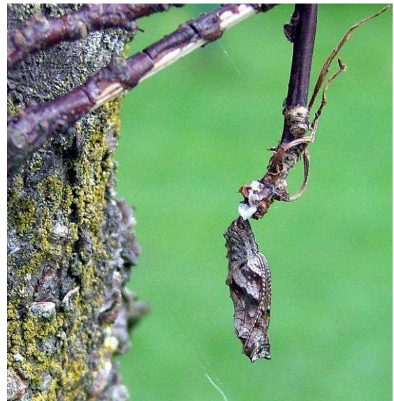
Abbildung 21: Die Puppe ist bestens getarnt und in freier Natur kaum auffindbar.

Unter diesen Bedingungen frisst die Raupe bis sie ausgewachsen ist und sich anschließend verpuppt. Nach ca. 14 Tagen schlüpfen die Falter noch im selben Jahr als 2. Generation aus. In der Natur ist nur eine Generation üblich: Die Raupe überwintert im zweiten (L2) oder dritten Stadium (L3), und verpuppt sich frühestens im zweiten Jahr. Nach dem Ausschlüpfen gehen die gezüchteten adulten Tiere gleich in Kopula und sorgen für weiteres Ei-Material, welches nach wenigen Tagen aus dem Ei schlüpft und so dann in die Überwinterung geht.