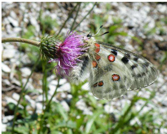
Abbildung 40: Dieses Bild entstand am 4. Juli 2011. Das Männchen stärkt sich mit Nektar von einer Distel und setzt dann die Suche nach den Weibchen wieder fort. Die Saugpflanzen sind ganz wichtig für eine kräftige Apollopulation. Neben Disteln besuchen sie auch Skabiosen oder das gelbfarbenen Kreuzkraut.

Abbildung 39: Ein prächtig gefärbtes Weibchen des Apollos bei der Eiablage auf der Futterpflanze, dem Weißen Mauerpfeffer.