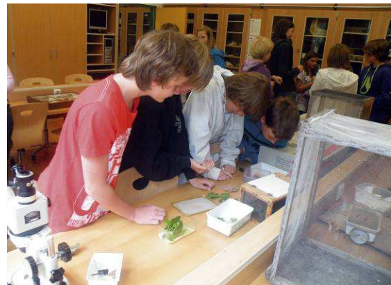
Abbildung 14: Ganz vertieft bewundern die HIB-Schüler die Raupen und untersuchen auch die Farbenpracht der Flügel unter dem Mikroskop.

Gemeinsam werden die gesammelten Raupen wie etwa vom Kleinen Fuchs in die Klasse gefüttert und nach dem Schlupf mit großer Freude und Stolz in die Freiheit entlassen.