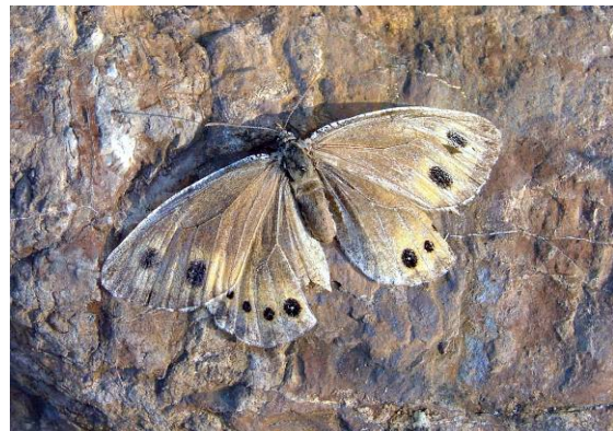
Abbildung 33: Dieses schon ein wenig mitgenommene Weibchen ist auch auf der Oberseite heller.

Schnell entwischt er den Blicken des Naturbegeisterten ob seiner raschen Flugweise und der besonderen Tarnung seines Falterkleides.