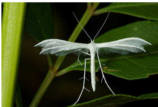
Abbildung 9: Pterophorus pentadactylus (Linné, 1758)

Bei einer zweiten Gruppe sind die Hinterflügel schon in 3 „Federn“ gespalten, die Vorderflügel aber nur wenig verändert. Bei den am weitesten entwickelten Federmotten sind schließlich auch die Vorderflügel tief gespalten und die beiden Zipfel ebenfalls zu federartigen Gebilden umgewandelt. Bei den Federgeistchen auf der anderen Seite, sind schließlich Vorder- und Hinterflügel in je 6 Federn gespalten.