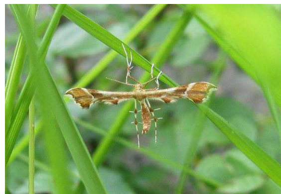
Abbildung 7: Cnaemidophorus rhododactyla ([Denis & Schiffermüller], 1775)

Zwei Gruppen von heimischen Schmetterlingen haben diesen Weg der Evolution beschritten, die Federmotten (Pterophoridae, Abb 5 - 9) und die Federgeistchen (Alucitidae, Abb. 10). Bei den Federmotten gibt es dabei alle Übergänge.