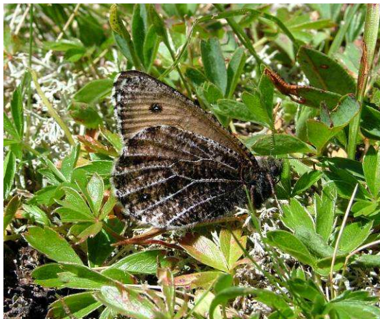
Abbildung 29: Das Männchen vom O. glacialis ist etwas dunkler als das Weibchen. Er ist sehr scheu.

Eine Herausforderung der besonderen Art ist die Zucht vom Gletscherfalter, da er ein zweijähriges Zyklus aufweist. Da gilt es vorerst einmal an diesen scheuen und schnellen Flieger heranzukommen, am besten in der Tauernregion, ab ca. 1900 m Höhe.