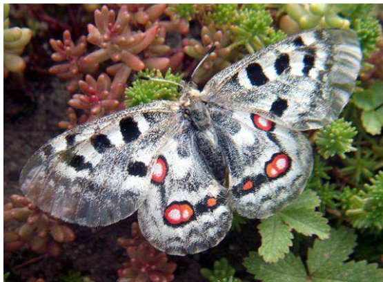
Abbildung 39: Ein prächtig gefärbtes Weibchen des Apollos bei der Eiablage auf der Futterpflanze, dem Weißen Mauerpfeffer.

Abbildung 38: Auf dem linken Bild kann man gut erkennen, wie das Biotop im Laufe der Jahrzehnte zugewachsen ist, und dadurch dem Apollofalter die Nahrungsquelle, die Fetthenne entzogen wurde. Die Folge war, dass er in den 80er Jahren verschwand. Nach den Rodungen im Frühjahr 2011 präsentierte sich das Biotop wieder in seinem einstigen Zustand. Durch diese einzigartige Naturschutzaktion mittels Rodung, Einsetzen der Futterpflanzen und Freilassen gezüchteter Apollofalter aus der Region wurde dem prächtigen Tagfalter ein Refugium wieder zurückgegeben.