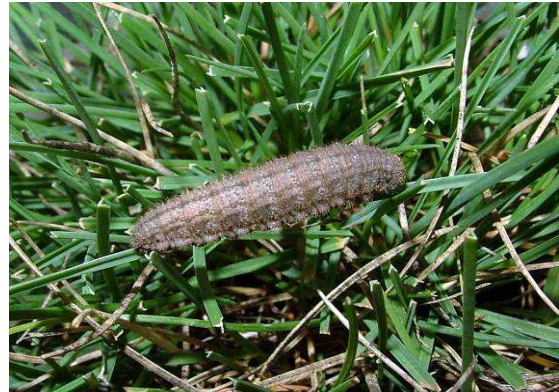
Abbildung 26: Die Raupe von Erebia styx ist im dünnen Gras bestens getarnt. Sie verlässt ihr Versteck nur nachts. Beim Fotografieren muss man allerdings schnell sein, denn sobald eine Lichtquelle erscheint, kriecht sie schon wieder in die Grashalme hinunter und wartet wieder bis es finster wird.

eintopft. Die Räumchen setzt man mit einem Pinsel auf die Grashalme. Schon in den ersten Nächten können die lichtscheuen Raupen ganz oben an den Grashalmen beobachten werden.