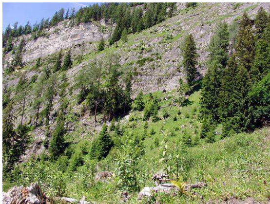
Abbildung 3: Lebensraum der Rotflügeligen Schnarrschrecke im Gasteinertal, im Gebiet westlich der Gasteiner Höhe.

Unmittelbar am Fuß der steilen, kalkreichen Südhänge westlich der Gasteiner Höhe befinden sich großflächige, extensiv beweidete Almflächen, die für wärmeliebende Arten als Habitat prädestiniert sind.