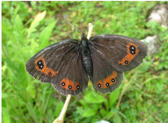
Abbildung 23: Das Weibchen vom Mohrenfalter Erebia styx trifft man meist nur, wenn es an den Blüten von Disteln Stärkung sucht.

Vielfach trifft man die Erebia styx (Freyer, 1834) in denselben Biotopen wie der Apollofalter. Beide mögen es heiß und trocken. Geröllhalden und stark felsdurchsetztes Offenland: Da befinden sich diese Arten in ihrem Element. Denn dort wächst auch die Futterpflanze der Raupe des Styx-Mohrenfalters, der Blauschwengel. Diese kurze und dünne Grasart ist sehr widerstandsfähig und gedeiht gerade auf trockenem Boden.