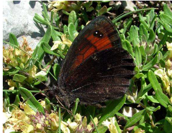
Abbildung 28: An der Unterseite der Hinterflügel kann man das Männchen gut erkennen. Sie ist sehr dunkel, marmoriert und mit nur sehr kleinflächigen weißen Flecken.

Die Falter schlüpfen dann ab etwa Mitte Juni aus; sie paaren sich in Gefangenschaft problemlos. Auch unter Zuchtverhältnissen kommen zuerst die Männchen zum Vorschein, etwas später auch die Weibchen.