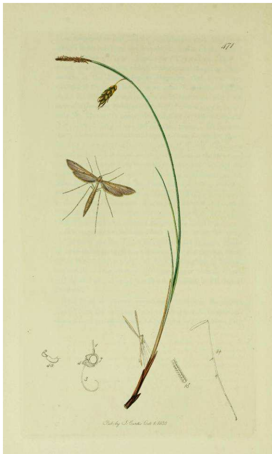
Abbildung 5: Agdistis sp. (aus British Entomology, vol. 6, pl. 471)

Weder von scharfäugigen Falken, die pfeilschnell durch die Lüfte jagen, noch von lustig zwitschernden Spatzen am Futterhäuschen soll hier die Rede sein, sondern wieder einmal von Schmetterlingen, von gefiederten Schmetterlingen! So wirklich Federn im streng wissenschaftlichen Sinne tragen diese Tiere zwar nicht, aber