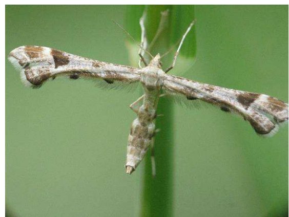
Abbildung 6: Platyptilia gonodactyla ([Denis & Schiffermüller], 1775)

die Umgestaltung ihrer Flügel in federartige Gebilde ist schon sehr bemerkenswert.