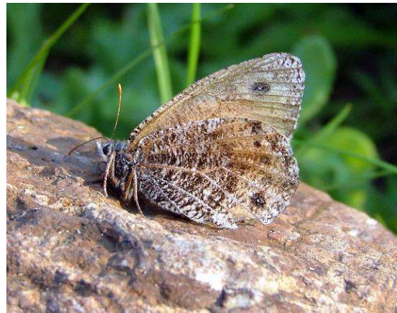
Abbildung 32: Das Weibchen des Gletscherfalters ist etwas heller als das Männchen. Sie ruht sich gerne auf Steinen aus, wobei sie bestens getarnt ist.

Da die Raupe in den alpinen Biotopen zweimal überwintert, kommt die Art nur alle zwei Jahre gehäuft zum Vorschein, in den Hohen Tauern in ungeraden Jahren. Die Überwinterung erfolgt im ersten Jahr als Jungraupe, im zweiten als ausgewachsene Raupe. Die Raupen sind sehr gut an ihre Umgebung angepasst und kaum auffindig zu machen. In dem jeweiligen Flugjahr ist der Gletscherfalter, der es immer eilig hat, oft zahlreich zu beobachten.