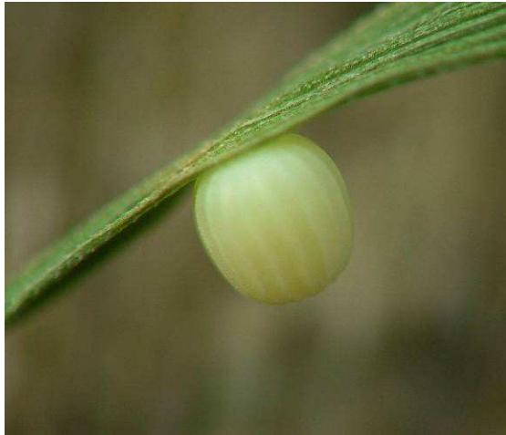
Abbildung 25: Das grünlichgelbe Ei von Erebia styx , welches an einen Grashalm gelegt wurde. Bevor die Raupe schlüpft verfärbt es sich deutlich dunkler.

trifft man sie an, wenn sie an Blüten saugen, wie etwa an Disteln oder Skabiosen. Seltener kann man sie dabei beobachten, wie sie am steinigen Untergrund sitzend ihre Eier in die Grashüschel vom Blauschwingel ablegen. Sie Heften diese aber auch unmittelbar daneben an Steine oder dürre Halme.