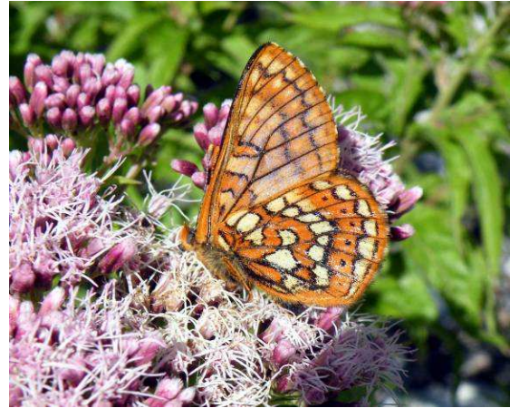
Abbildung 45: Erst gerade vor kurzem im Stoissengraben neu entdeckt: Der Veilchenscheckenfalter ( Euphydryas cynthia , [Denis & Schiffermüller], 1775).

In den nächsten Wochen werden noch weitere Entbuschungen und Einpflanzungen im gesamten Areal im Stoissengraben durchgeführt bzw. auch weitere Falter freigesetzt.