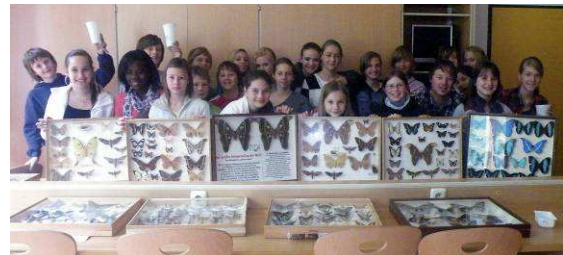
Abbildung 13: Die größten und die kleinsten Schmetterlinge aus aller Welt wurden in den zahlreichen Schaukästen bewundert.

larven kennen. In kurzer Zeit sind die Jugendlichen mit den Schmetterlingen vertraut und fast jeder möchte auch so einen Falter einmal züchten.