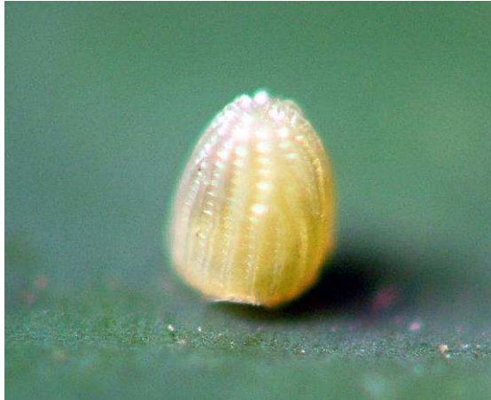
Abbildung 18: Das winzige Ei von Boloria thore wird im Gras an die Halme einzeln gelegt.

einen idealen Moment für einen Schnappschuss mit der Kamera.