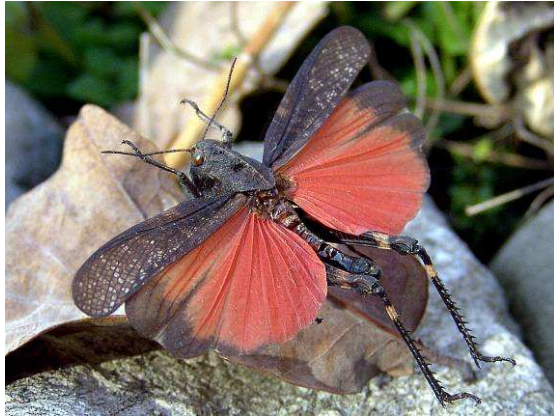
Abbildung 2: Männchen der unverwechselbaren Rotflügeligen Schnarrschrecke Psophus stridulus beim Abflug (Bildmontage).

Unmittelbar am Fuß der steilen, kalkreichen Südhänge westlich der Gasteiner Höhe befinden sich großflächige, extensiv beweidete Almflächen, die für wärmeliebende Arten als Habitat prädestiniert sind.