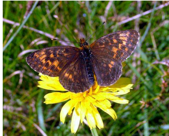
Abbildung 22: Ein dunkles Exemplar von dem Alpen-Perlmutterfalter bei einer kurzen Rast.

Sie können in eng begrenzten Bereichen teilweise recht zahlreich sein, wobei sie meist schon nach kurzer Entfernung plötzlich aus dem Blickwinkel entschwinden.