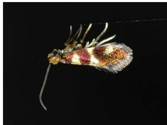
Abbildung 1: Micropterix myrtetella Zeller, 1850, mit weniger als 1cm Flügelspannweite eine der kleinsten Urmotten, ruhend auf einem Spinnfaden.

Mitte Mai unternahm ich eine entomologische Reise nach Kroatien und Montenegro. Dabei gelang mir dieses wunderbare Bild eines "Hochseil-Artisten" auf einem Spinnfaden. Nach dem Foto flog dieses Tierchen auf und davon.