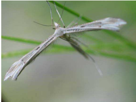
Abbildung 8: Stenoptilia coprodactyla (Stainton, 1851)

Die urtümlichen Formen haben noch ganzrandige Flügel, die Flügel sind in Ruhestellung aber schon zum Teil eingerollt und bieten so Luftströmungen weniger Angriffsfläche.