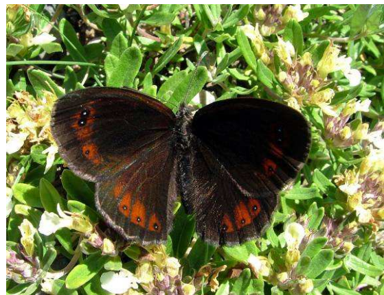
Abbildung 27: Das Männchen von Erebia styx ist dunkelbraun gefärbt mit kleinen weißen Punkten und kräftig rotbraunen Flecken.

Bis zur Überwinterung im 2. oder auch im 3. Stadium, ab etwa Ende Oktober, sind die Raupen aktiv. Danach lassen sie sich nicht mehr blicken. Den Zuchtbehälter stellt man dann am besten an eine geschützte Stelle (z. B. südostseitig) unter einem Dachvorsprung im Garten oder am Balkon. Ab ca. Anfang März, wenn die Temperaturen schon wieder etwas milder werden, kommen die überwinterten Raupen wieder zum Vorschein und ernähren sich wieder, bis sie sich schließlich im Mai