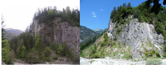
Abbildung 38: Auf dem linken Bild kann man gut erkennen, wie das Biotop im Laufe der Jahrzehnte zugewachsen ist, und dadurch dem Apollofalter die Nahrungsquelle, die Fetthenne entzogen wurde. Die Folge war, dass er in den 80er Jahren verschwand. Nach den Rodungen im Frühjahr 2011 präsentierte sich das Biotop wieder in seinem einstigen Zustand. Durch diese einzigartige Naturschutzaktion mittels Rodung, Einsetzen der Futterpflanzen und Freilassen gezüchteter Apollofalter aus der Region wurde dem prächtigen Tagfalter ein Refugium wieder zurückgegeben.