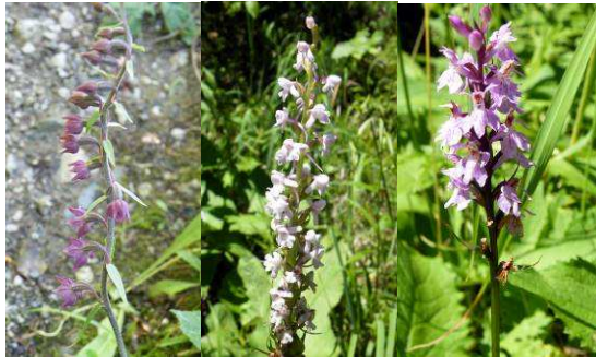
Abbildung 47: Eine Auswahl an Orchideen, die in dem Biotop im Stoissengraben prächtig gedeihen. Hier wächst auch der schöne Türkenbund an mehreren Stellen.

lingsarten ist für Naturbegeisterte ein interessantes Erlebnis und eine neue Attraktion. Der Weg entlang des Buchweissbaches auf der linken Seite taleinwärts ist leicht erreichbar und ohne Erschwernisse zu bewältigen.