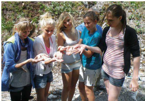
Abbildung 35: Behutsam wurden von der Mädchengruppe einige Raupen des Apollofalters im Biotop verteilt.

Ein einzigartiges Naturschutzprojekt, die Wiedereinbürgerung des Apollofalters im Stoissengraben bei Saalfelden wurde im Frühjahr 2011 in Angriff genommen. Dieses Projekt wurde vom Saalfeldner Schmetterlingskundler Otto Feldner initiiert und von der Naturschutzabteilung des Landes Salzburg und der Biotopschutzgruppe Pinzgau (Obmann Ferri Robl) unterstützt.