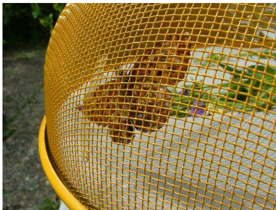
Abbildung 19: Das Weibchen bei der Eiablage unter einer feiner Gitterhaube, die ansonsten als Abdeckung für Speisen dient.

Schwierig wird es dann, wenn man nach den Raupen sucht. Es ist fast unmöglich diese im Frühjahr nach der Überwinterung aufzustöbern. So versucht man am besten mit der Aufzucht: Dabei gab sich ein Weibchen großzügig und legte Eier auf das stabile Gitter einer halbrunden Abdeckung für Kuchen oder Torten.