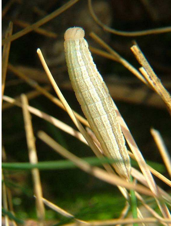
Abbildung 31: Die Raupe des Gletscherfalters überwintert in freier Natur gleich zwei Mal. Unter Zuchtbedingungen kann sie sich schon nach der ersten Überwinterung bis zum Falter entwickeln...

Die Verpuppung erfolgt auch zwischen den Grasnarben gut versteckt, wobei die Puppen fast nicht auffindbar sind.