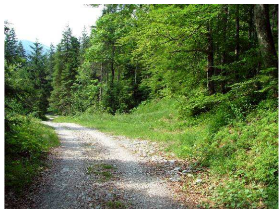
Abbildung 17: Hier hat der Alpen-Perlmutterfalter Boloria thore einen idealen Lebensraum. Auf ca. 900 m Höhe in einem Seitental des Urslautales bei Hinterthal ist diese Art noch häufig anzutreffen.

Er liebt die Abwechslung zwischen sonnigen Plätzchen und schattigen Stellen, die die lichten Mischwälder charakterisieren, die er besiedelt.