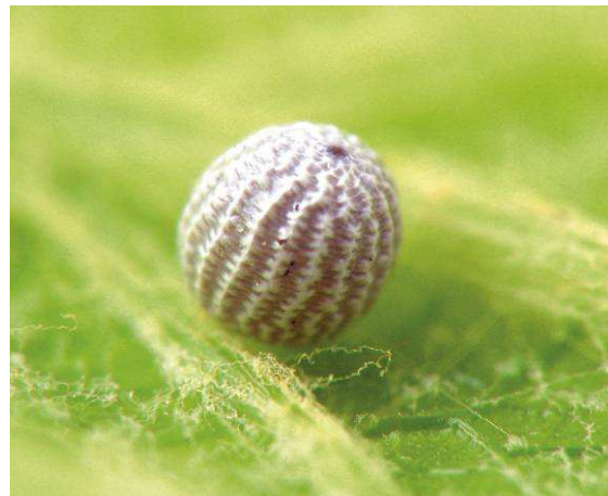
Abbildung 30: Das aufwendig geformte Ei von O. glacialis wird meist an festere Gegenstände wie Steine oder Halme gelegt.

Schon nach 14 Tagen kommt die Raupe aus dem Ei und frisst diverse Gräser. Die Jungraupe überwintert im dritten oder