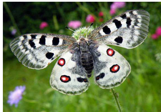
Abbildung 37: Der Apollofalter ist wieder in sein "Reich" zurück gekehrt, wie hier dieses imposante Weibchen, welches nach der Stärkung abermals mit der Eiablage fortfährt.

Die dortige südexponierte Hanglage war in den letzten Jahrzehnten völlig verbuscht und zugewachsen. Dadurch wurde dem Apollofalter die Lebensgrundlage entzogen. Die Futterpflanze, der Weiße Mauerpfeffer ( Sedum album L.) erstickte unter dem Strauchwerk und verschwand, der Apollofalter starb aus.