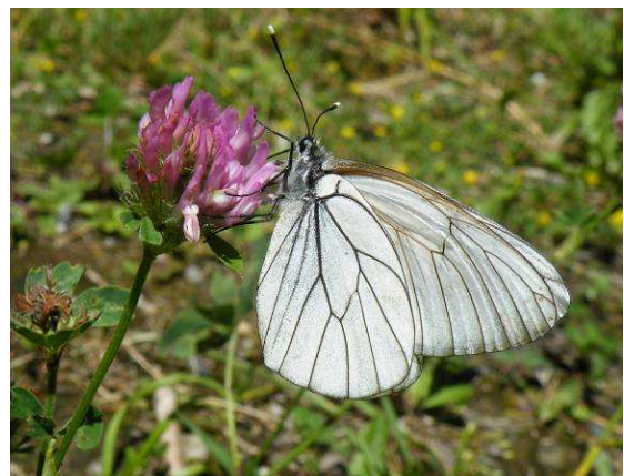
Abbildung 42: Nahe dem betroffenen Biotop diente der nektarspendende Klee für den Baumweißling ( Aporia crataegi (Linnaeus, 1758)) als willkommene "Tankstelle".

Abbildung 41: Bereits am 31. Mai gab es eine aufregende Situation für die SchülerInnen, durch diese unerwartete Begegnung mit einem Apollopärchen, welches sich im neuen Biotop schon sehr wohlfühlen scheint.