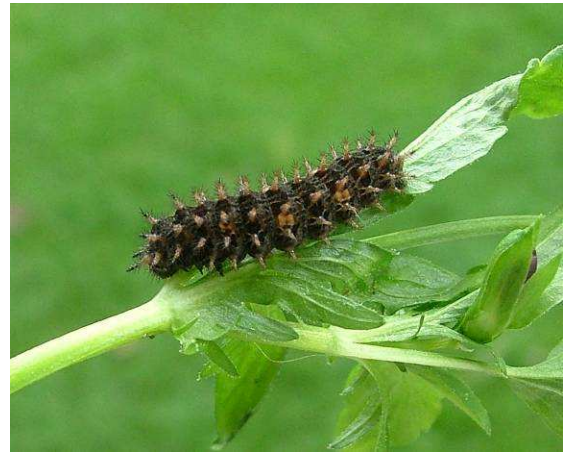
Abbildung 20: Die erwachsene Raupe in L5 nach einer Sommerzucht, die in dunklen Aufbewahrungsstellen durchgeführt wurde.

Nach etwa 10 Tagen schlüpfen bereits die kleinen Räumchen. Als Futter gibt man am besten die üblichen Stiefmütterchen, wie man sie in den Gärtnereien erhält. Wichtig ist dabei, die Räumchen dunkel zu halten und einer konstanten Wärme auszusetzen, wie man sie z. B. in einen Raum vorfindet.