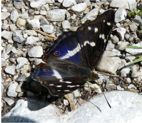
Abbildung 43: Frisch aus der Puppehülle entschlüpft, der blauschillernde Große Schillerfalter ( Apatura iris Linnaeus, 1758) zeigte sich am 4. Juli direkt am Weg des Stoissengraben-Biotops und saugte an den nassen Steinen.

Projekt engagiert. Mein Dank und meine Anerkennung gelten ganz besonders Frau Professorin Luise Wolf, die sich vorbildlich in den Dienst eines völlig neuen und interessanten Unterfangens stellt.