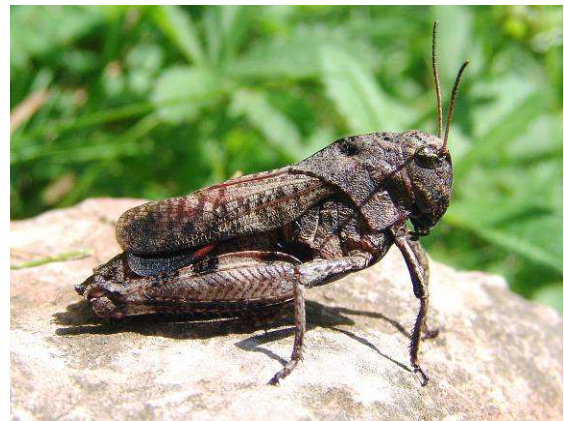
Abbildung 4: Erfolgreich groß gezogenes Weibchen der Rotflügeligen Schnarrschrecke aus dem Gasteinertal.