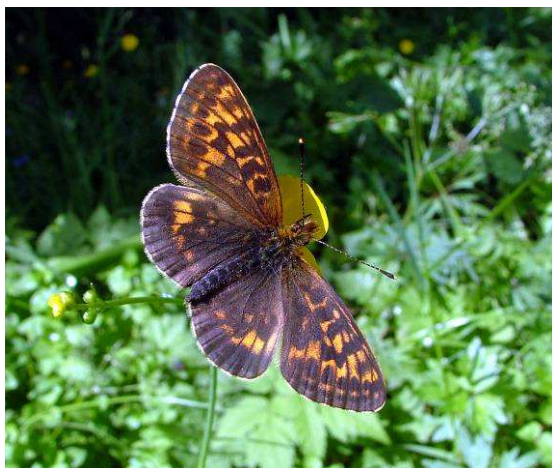
Abbildung 16: Ein frisch geschlüpftes Weibchen in mitten ihres Biotops saugt auf einer Hahnenfußgewächs.

Der Alpen-Perlmutterfalter Boloria thore (Hübner, 1803) findet in den Refugien im Saalachtal oder Urslautal ideale Lebensbedingungen.