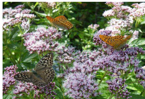
Abbildung 46: Kaiser(mantel)-Treffen ( Argynnis paphia (Linnaeus, 1758)) auf Wasserdost-Blüten, die genüsslich an deren Nektar saugen. Im Vordergrund die seltenere Weibchenform f. valesina .