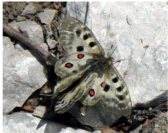
Abbildung 41: Bereits am 31. Mai gab es eine aufregende Situation für die SchülerInnen, durch diese unerwartete Begegnung mit einem Apollopärchen, welches sich im neuen Biotop schon sehr wohlfühlen scheint.

Nach der Bepflanzung wurden einige Raupen des Schmetterlings aus heimischen Beständen gleich auf die Futterpflanzen freigesetzt.