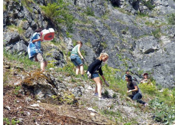
Abbildung 36: Im steilen, felsigen Gelände wurde von den SchülerInnen die Futterpflanze (Fetthenne aus heimischen Beständen) wieder eingesetzt.