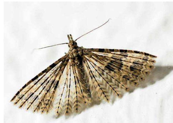
Abbildung 10: Alucita hexadactyla Linné, 1758

den ohnehin so leichten Schmetterlingsflügeln nicht wirklich überzeugend, und auch die geringere Angriffsfläche gegenüber Luftströmungen in Ruhestellung durch das Einrollen der Flügel ist ja schon ohne Aufspaltung der Flügel in Federn realisiert worden. Zudem gilt das zweite Argument nicht für die Federgeistchen, da sie ihre Flügel nicht einrollen.