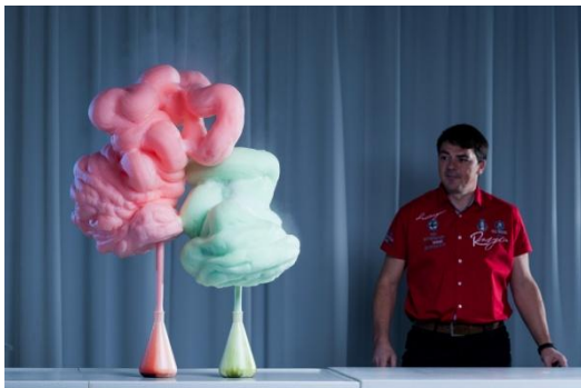
Elefantenzahnpasta: Schaumfontänen aus Wasserstoffperoxid