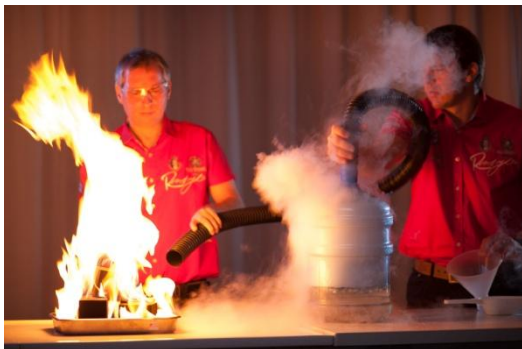
DIY: Aus Trockeneis und Wasser lässt sich ein wunderbarer Feuerlöscher bauen.