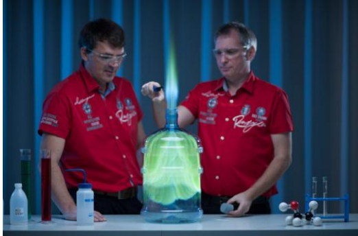
Wow-Effekt: Der grüne Flammentornado entsteht durch die Verbrennung von Ethanol.

Alle Bilder: © Haus der Natur/Simmerstatter. Die Bilder dürfen im Rahmen von Berichten zur Chemieshow im Haus der Natur und unter Angabe des Copyrights honorarfrei verwendet werden.