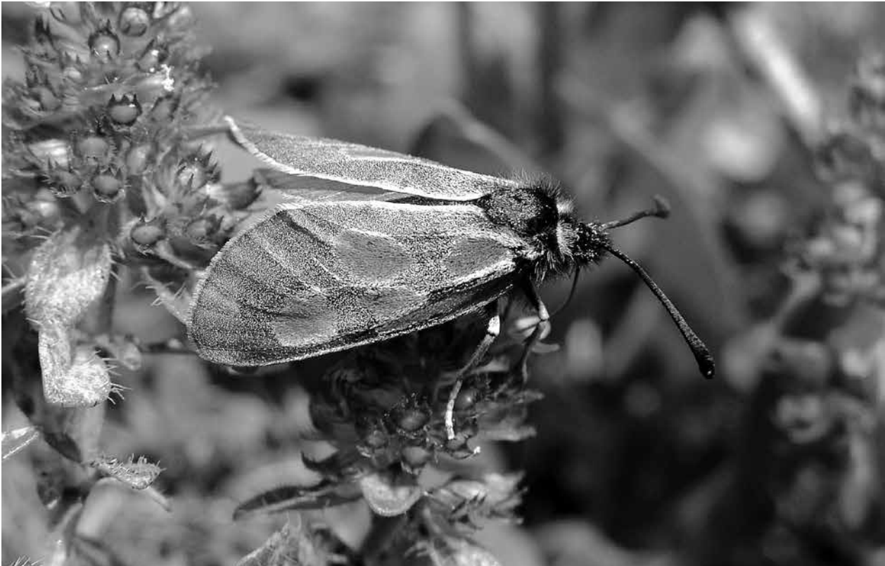
Das Alpen-Widderchen Zygaena exulans , eine typische Art des Glocknergebietes.