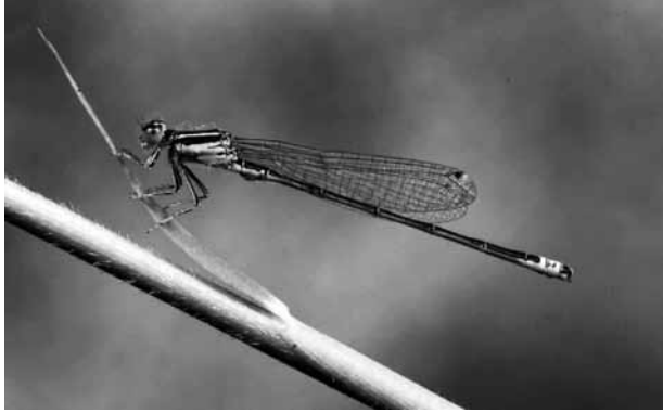
Abb. 12: Die Kleine Pechlibelle ( Ischnura pumilio ) eine typische und gefährdete Pionierart konnte bereits kurz nach Fertigstellung der Gewässer im Gebiet festgestellt werden.

Zusätzlich konnte dort im Rahmen einer Begehung von Patrick Gros im September 2009 die Gemeine Winterlibelle ( Sympecma fusca ) nachgewiesen werden, die nach RAAB et al. 2007 in Österreich als gefährdet (vulnerable, VU) anzusehen ist.