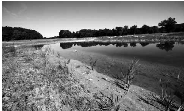
Abb. 5: Die „Eisvogelwand“ im Süden der Geländeabsenkung bietet ideale Voraussetzungen zur Anlage von Bruthöhlen.