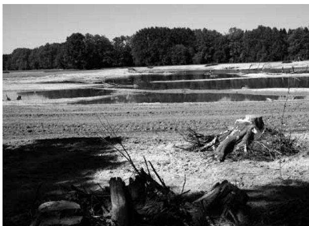
Abb. 7: Am Rand der Biotopfläche wurden die im Zuge der Rodung anfallenden Wurzelstöcke zur Strukturierung des Waldrandes eingebaut, in Hintergrund die großflächigen Stillgewässer mit günstigen Voraussetzungen für die natürliche Sukzession..

Salix capria Salix daphnoides Salix eleagnos Salix fragilis Salix myrsinifolia Salix purpurea Salix x rubens Salvia glutinosa Scrophularia nodosa Senecio vulgaris Setaria pumila Setaria italica ssp. italica Silene dioica Silene vulgaris Sinapis alba Solanum nigrum Solidago canadensis Sonchus asper Sonchus oleraceus Stachys sylvatica Symphytum officinale Taraxacum officinale agg. Trifolium hybridum Trifolium pratense Trifolium repens Tussilago farfara Urtica dioica Verbascum densiflorum Veronica arvensis Veronica chamaedrys ssp. chamaedrys Veronica persica Veronica serpyllifolia Vicia cracca Vicia sepium Vicia tetrasperma Viola arvensis