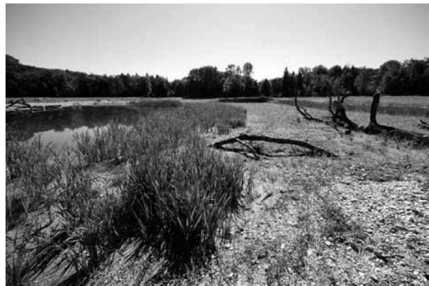
Abb. 4: Die dominierende Pflanzenart in den Flachwasserbereichen ist der Breitblättrige Rohrkolben ( Typha latifolia )

Chaerophyllum hirsutum Chenopodium album Chenopodium polyspermum Cirsium arvense Cirsium oleraceum Cirsium vulgare Conyza canadensis Corylus avellana Crataegus monogyna Dactylis glomerata