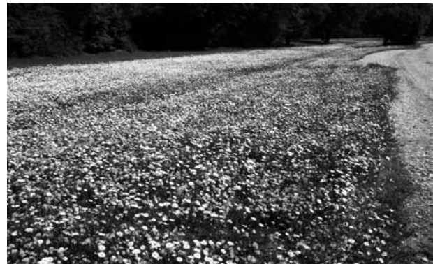
Abb. 8: Die eingesäten haben sich Frühjahr 2009 zu einem beeindruckenden Blütenmeer entwickelt.

Diese Art wird sowohl in der Roten Liste des Bundeslandes Salzburgs als auch in jener Oberösterreichs als gefährdet (Gefährdungsstufe 3) geführt. Diesbezüglich sei darauf hingewiesen, dass die Gefährdungseinstufung in Salzburg nicht mehr aktuell ist. Da nur mehr wenige Populationen dieser