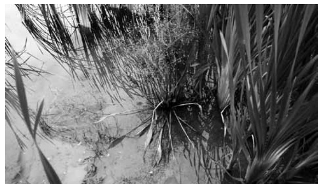
Abb. 10: Der Lanzett-Froschlöffel zeigt selbst bei großen und üppig wachsenden Exemplaren schmale, kontinuierlich in den Blattstiel übergehende Blattspreiten.