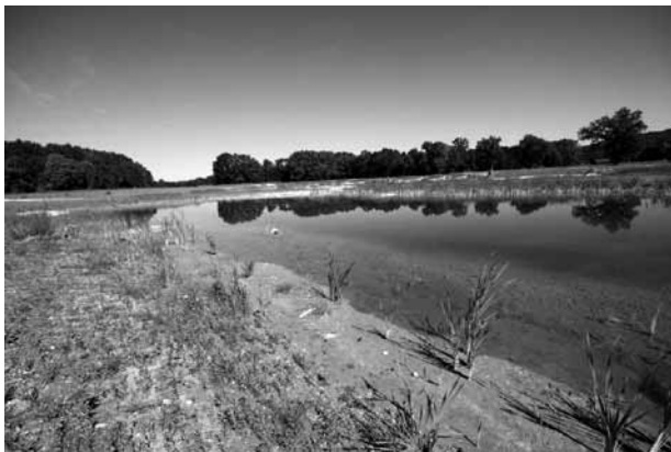
Abb. 3: Über weite Strecken sind die Ufer noch im Herbst 2008 unbewachsen

Zu dem fand im Zuge des Bauloses „Sanierung untere Salzach“ eine Umsiedlung der Herpetofauna aus einer nahegelegenen privaten Schottergrube statt.