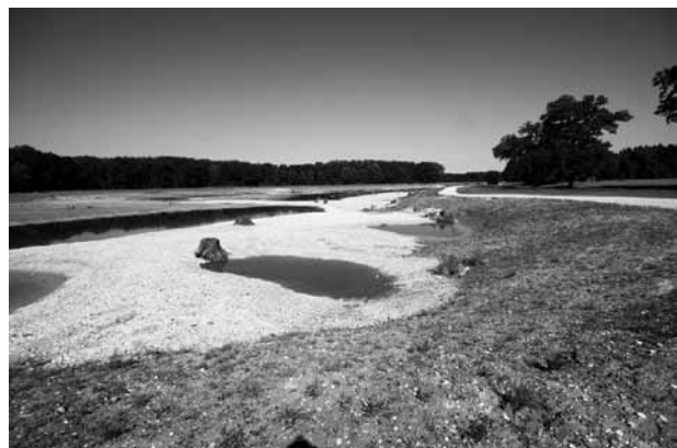
Abb. 6: Weite Flächen der Geländeabsenkung wurden der natürlichen Sukzession überlassen.