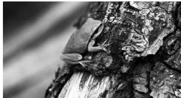
Abb. 11: Einer der ersten der in der Oberau geborenen Laubfrösche ( Hyla arborea )

Im Jahr 2009 konnten im Zuge mehrerer Begehungen bis zu 50 rufende Laubfrösche im Bereich der Oberau festgestellt