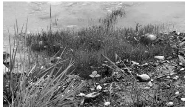
Abb. 9: Eleocharis acicularis konnte an den Ufern der Gewässer durch die Schlammverfrachtung aus der Ettenau neu angesiedelt werden.